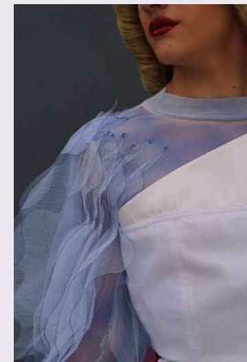
Aperçu d'une création d'un jeune styliste de l'école ESIMODE Toulouse..