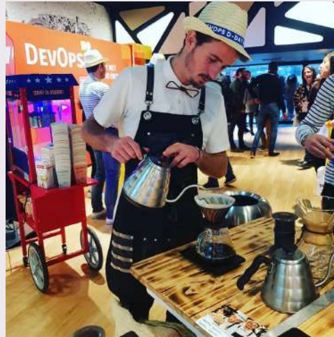
L'art du Slow Coffee avec Florian's Coffee