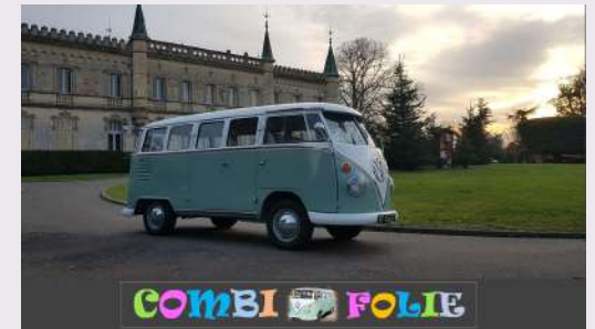
Se marier en Combi VW avec Combi Folie.