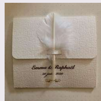
Flours & décorations : de gauche à droite : composition florale de Nadezda, création de Auréa Déco, décor champêtre de Le Temps d'un Rêve