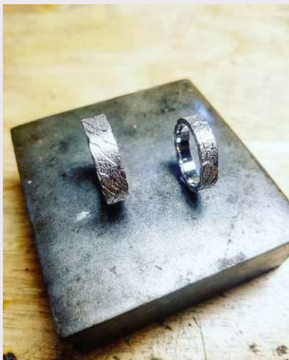
Alliances en or blanc, sur mesure Gjoaillerie