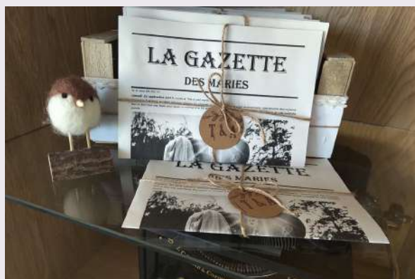
La gazette des Mariés, une conception Plume & Coquelicot