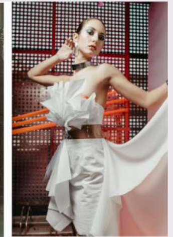
Deux robes de mariée de création de Diva la Mariée exposées sur les premiers salons du mariage de Toulouse, et une création de l'Ecole ESIMODE Toulouse.