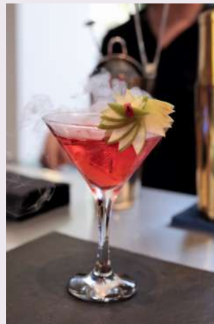
Platines & Cocktail