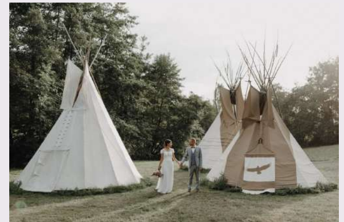
Ambiance "Tipi" avec Seize the Day Events.