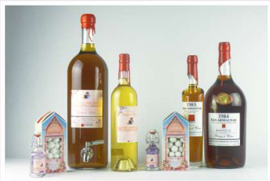
Apéritifs de fabrication artisanale à base de fruits, armagnac, liqueurs, bières, bonbons, étiquettes et bouteilles personnalisables - Maison Aurian