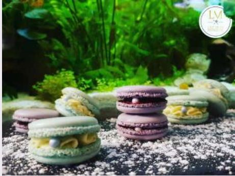
Macarons customisés - LM L'Art de la Pâtisserie