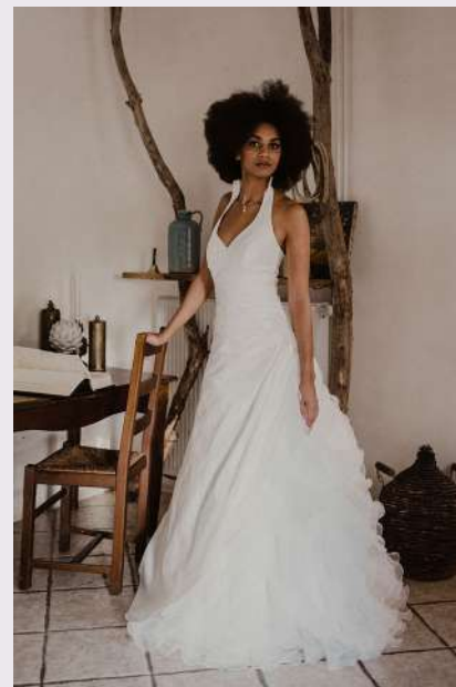
Collection 2020 Carrière Mariage NG