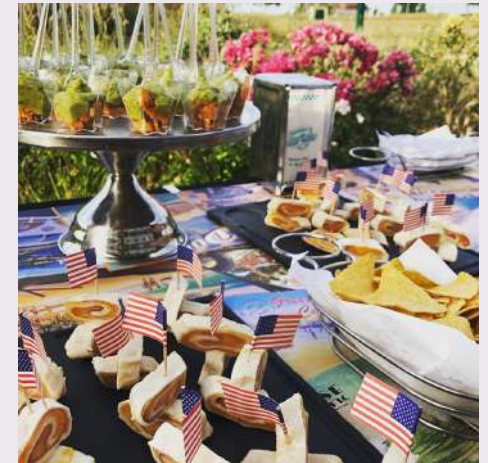
Les services traiteur de Tommy's Events.